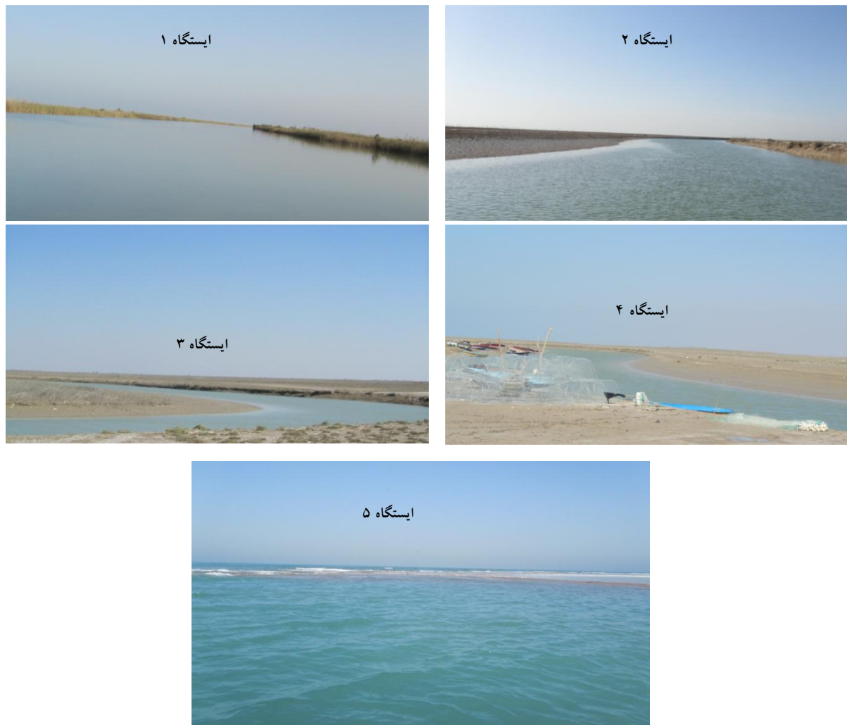
شکل ۲. ایستگاه‌های پنج‌گانه مورد مطالعه در مصب رودخانه حله، استان بوشهر

جدول ۱. پارامترهای آب در فصول مختلف در رودخانه حله، داده‌ها نشان‌دهنده میانگین \pm خطای استانداردند. حروف مشابه در هر ردیف نشان‌دهنده نبود اختلاف معنی‌دار است ( P > 0.05 )