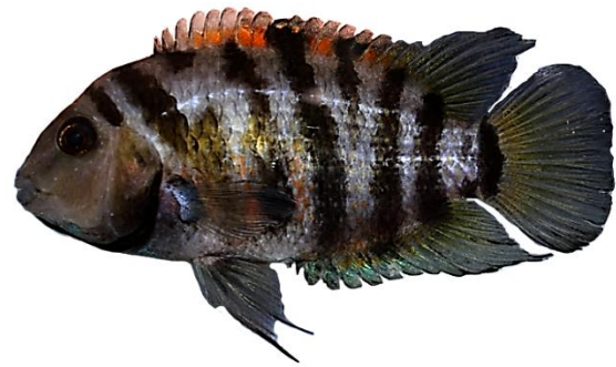
شکل ۲- سیکلید گورخری، Amatitlania nigrofasciata .

پراکنش: دامنه پراکنش بومی این گونه مربوط به کشور الجزایر و شمال آفریقا است. در مورد نحوه ورود این گونه به آب‌های داخلی ایران اطلاعاتی مستندی در دسترس نیست. در حال حاضر به‌عنوان گونه‌ای غیربومی برای آب‌های داخلی ایران محسوب می‌گردد. جمعیت‌های این گونه از تالاب‌های شادگان، هورالعظیم و رودخانه‌های کارون، دز، کرخه و جراحی (حوضه آبریز تیگره) و رودخانه مند از حوضه آبریز