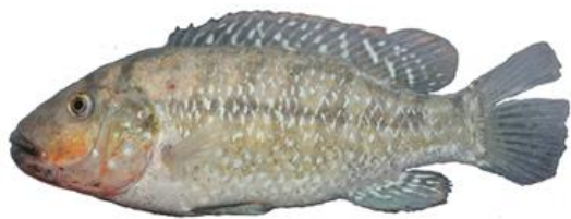
شکل ۵- سیکلید پارسی، Iranocichla persa

جانبی به صورت محدب بوده و در نیمه فوقانی بدن قرار دارد، از پشت سرپوش آبششی شروع شده و تقریباً تا انتهای باله پشتی ادامه دارد. قطعه دوم خط جانبی در میانه بدن قرار داشته و از قسمت ابتدای باله مخرجی شروع شده و تا انتهای ساقه دمی ادامه پیدا می کند.