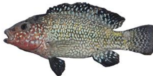
شکل ۴- سیکلید هرمز، Iranocichla hormuzensis

ریخت شناسی: باله پشتی دارای ۱۷-۱۴ شعاع سخت و ۱۰-۹ شعاع نرم، باله مخرجی دارای ۳ شعاع سخت و ۸-۶ شعاع نرم، باله سینه‌ای دارای ۱۲-۱۱ شعاع و باله سینه‌ای دارای ۱۲-۱۱ شعاع است. کمان آبششی دارای ۱۷-۱۴ خار است. ۱۷-۲۴ فلس روی قسمت میانی بدن وجود دارد. ستون مهره دارای ۳۰-۲۸ ج سم مهره ۱ است. خصوصیات ریختی این گونه بسیار شبیه به I. hormuzensis است. در نرهای بالغ و دارای لباس عروس زیر سر و سینه نارنجی است (در I. hormuzensis سیاه رنگ و یا قرمز پر رنگ است)،