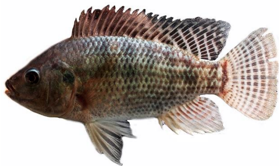
شکل ۷- تیلایپای نیل، Oreochromis niloticus .

رنگ صورتی تیره است. سر در جنس نرها در فصل تولید مثل به رنگ آبی متالیک و تیره است. بدن به رنگ نقره‌ای تیره و یا سبز زیتونی همراه با لکه‌های سیاه است. انتهای خلفی باله پشتی و در برخی موارد باله مخرجی دارای لکه‌های صورتی است، خط جانبی دو قطعه است. خط جانبی فوقانی از پشت سر پوش آبششی شروع شده و تا انتهای باله پشتی می‌رسد، خط جانبی تحتانی از دومین و یا سومین اشعه باله مخرجی شروع شده و تا انتهای باله دم می‌رسد. دارای دندان‌های با تراکم پایین بر روی فکین هستند. پراکنش: دامنه پراکنش بومی این گونه قاره‌های آفریقا و اورا سیاه شامل اردن، رودخانه نیل و سنگال، چاد، بنین، قسمت‌های میانی و جنوبی کشور نیجر است. در مورد نحوه ورود این گونه به آب‌های داخلی ایران اطلاعات مستندی در دسترس نیست. در حال حاضر به‌عنوان گونه‌ای غیر بومی برای آب‌های داخلی ایران محسوب می‌گردد. جمعیت‌های این گونه از رودخانه‌های کارون، اروند، بهمنشیر و همچنین کانال‌های آب در استان خوزستان (خرم‌شهر) صید شده‌اند (Valikhania et al., 2016).