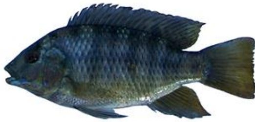
شکل ۳- تیلایپا شکم قرمز، Coptodon zillii .

جنس Tilapia منتقل نمود، اما بر اساس شواهد مولکولی Dunz و Schliewen (۲۰۱۳) این گونه را در جنس Coptodon قرار گرفت.