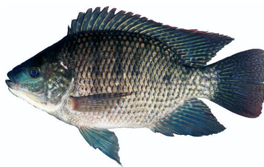
شکل ۶- تیلایپای آبی، Oreochromis aureus .

ریخت‌شناسی: باله پشتی دارای ۱۷-۱۵ شعاع سخت