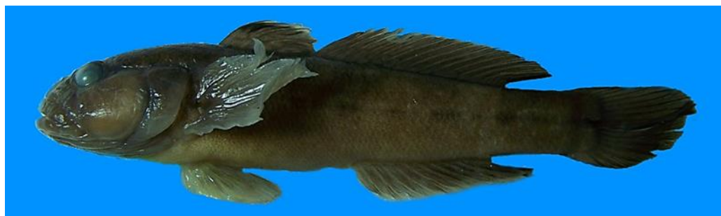
شکل ۱- نمای جانبی گونه گاوماهی ایرانی، Ponticola iranica از رودخانه سفیدرود.