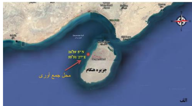
شکل ۱- محل نمونه برداری که با علامت قرمز مشخص شده است (الف)، نمونه خیار دریایی گونه H. leucospilota (ب).

مهار آنزیم لیپوکسیژناز براساس روش Wangenstein با اندکی تغییرات انجام شد، بدین صورت که محلول واکنش شامل: 237 U/ml (واحد در میلی لیتر) آنزیم لیپوکسیژناز، 33 μM میکرو مول لینولئیک اسید و 2 M مول بافر بورات با تنظیم pH روی ۹ آماده شد. در واکنش لینولئیک اسید و آنزیم ماده 13-S-hydroperoxyoctadecadienoic acid (13-HPODE) تولید می شود و در نهایت هیدرولیز شده و به ماده 13-S-hydroxyoctadecadienoic acid (13-HODE) تبدیل می گردد. با افزایش عصاره حاصل از خیار دریایی به مخلوط واکنش، فعالیت آنزیم LOX با اندازه گیری جذب نوری در 234 nm نا نو متر هر ۳۰ ثانیه تا ۵ دقیقه اندازه گیری شد (Wangenstein et al., 2004).